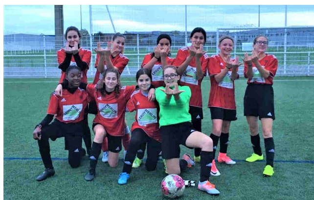
pôle féminin 19/20 : U15 F