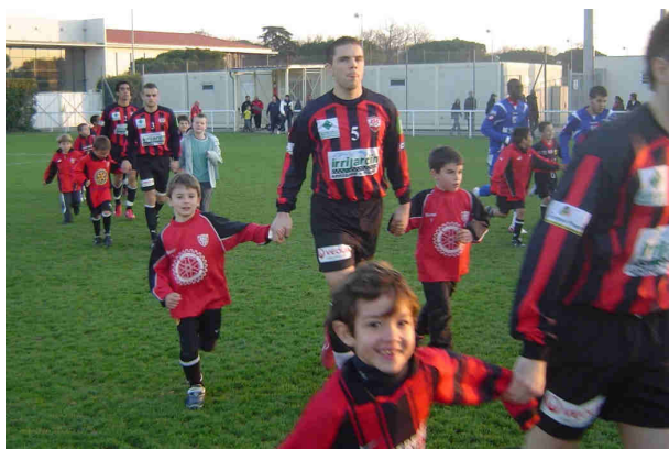
Le trait d'union très jeunes - Seniors

« Que chacun se sente appartenir à la JSC »